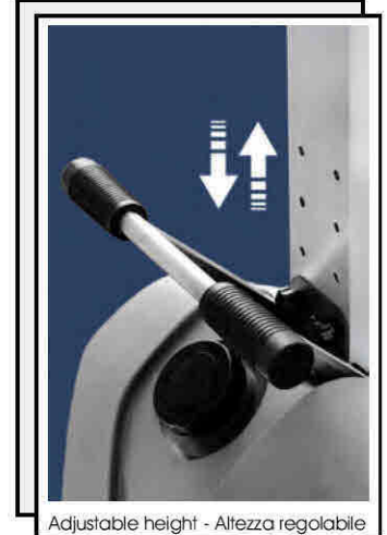
Adjustable height - Altezza regolabile