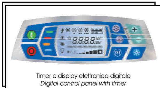
Timer e display elettronico digitale Digital control panel with timer

Dimensions: WxHxP 580x2050x580 mm Weight: 50 Kg (empty water tank)